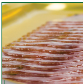
Нижняя жесткая металлизированная пленка со сварным слоем PE