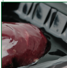
Нижняя жесткая термоформуемая пленка моно PET