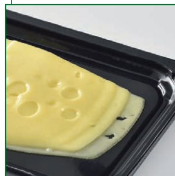
Полипропиленовый лоток PP

Высокобарьерные amSkinTop пленки прекрасно запаиваются к пленкам: