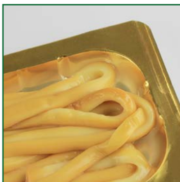
Нижняя жесткая металлизированная пленка со сварным слоем PE