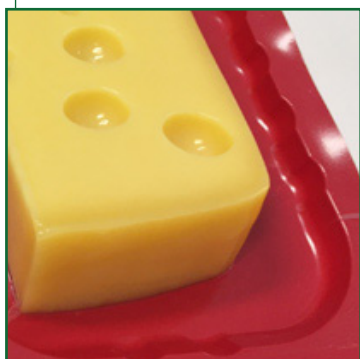
Окраска пленки в любой цвет